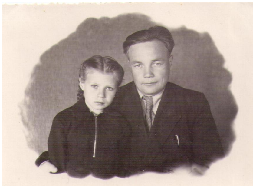
Отец и дочь