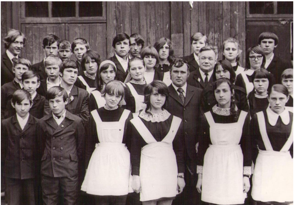
Школьные годы чудесные...